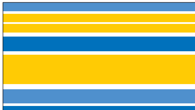
Visitkort, fram och baksida. 90x50mm